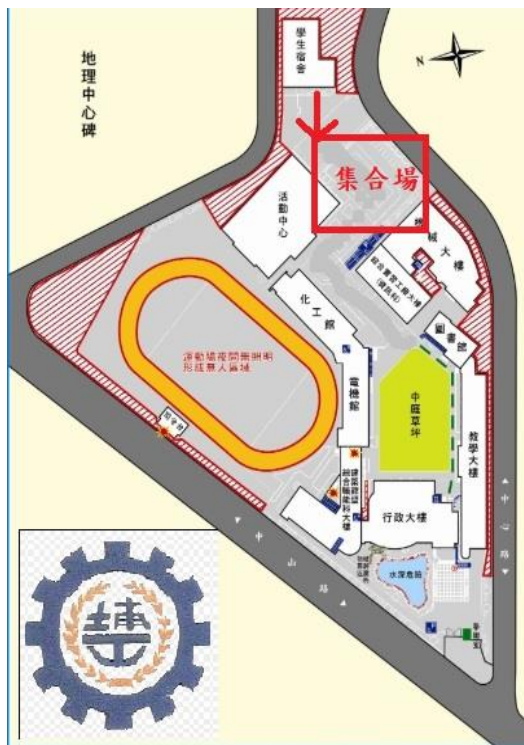
附圖：國立埔里高級工業職業學校學生宿舍緊急疏散路線圖